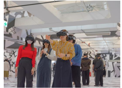
体験中のイメージ画像

「IMMERSIVE JOURNEY 名古屋」は、横浜に次ぐ国内 2 か所目として東海エリア初上陸となります。