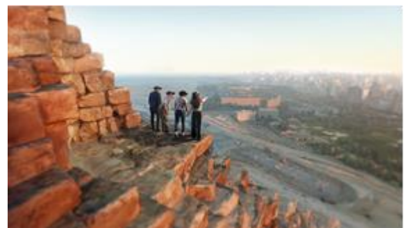
「Horizon of Khufu」イメージ画像