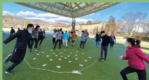
企業研修・団体プログラム

企業研修や学校行事などグループでの自然体験プログラムです。 事前予約が必要となりますので、お気軽にお問い合わせください。