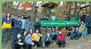
修学旅行・自然教育プログラム

森やコースを使った様々な課題に チームで挑戦していく団体様向け の研修プログラムです。