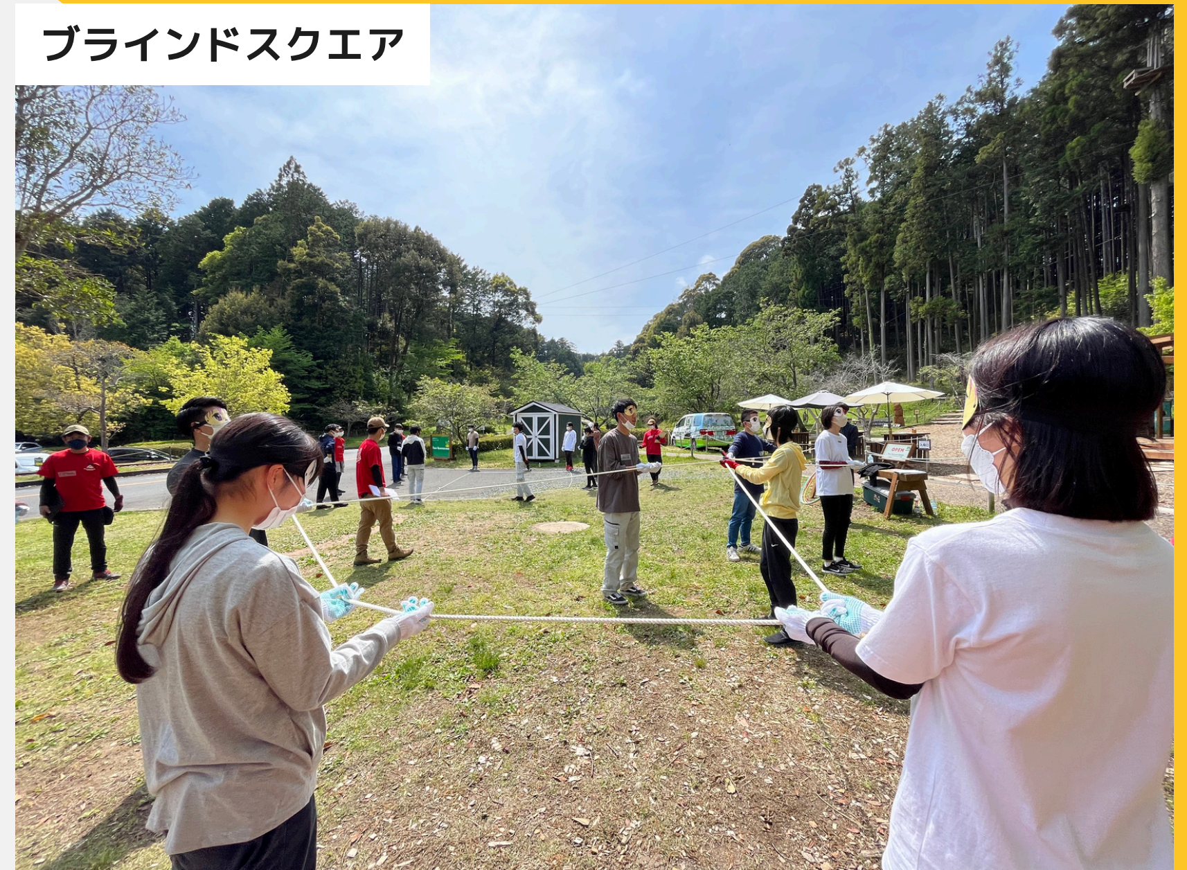
ブラインドスクエア

全員輪になり、目隠しの状態で手のひらにロープをのせます。ロープの全てを使って、指定する形を全員で協力して作ります。