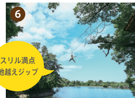
スリルと爽快感の池越えジップライン