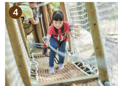
上級レベルの [ キャンピコース 3 ]