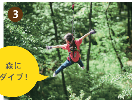
60m のジップスライド