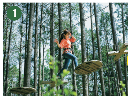
[ アドベンチャーコース 1 ] 腕試しの初級レベル