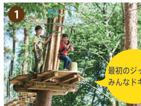
[ キャンピコース 1 ] まずは初級