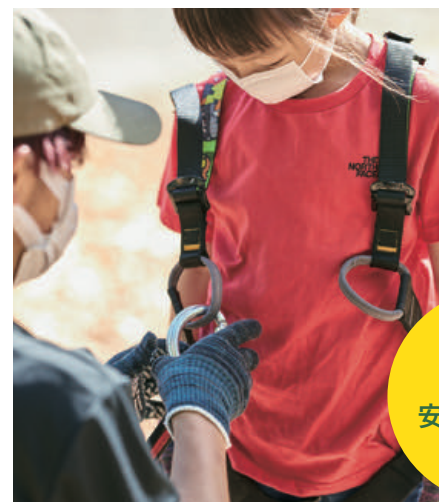
安全ベルトはトレーニングされた スタッフのみが装着可能