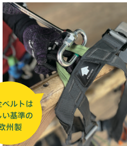
安全ベルトのメンテナンス