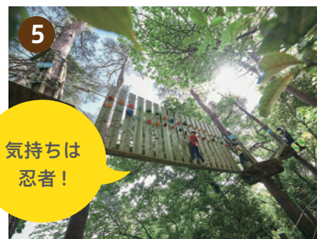
[ キャンピコース 4 ] コース終盤は徐々に難易度も上昇