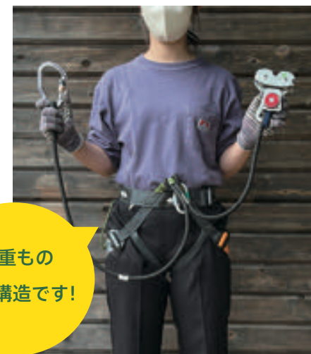
安全ベルト装着時