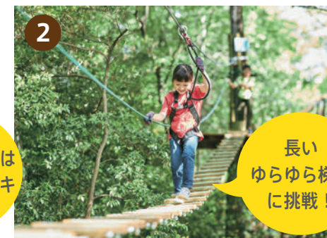
中級レベルの [ キャンピコース 2 ]