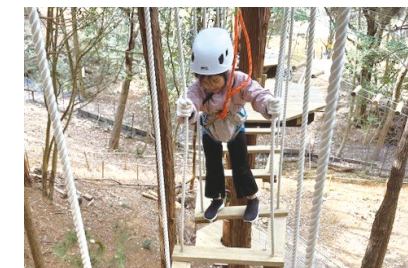
ボックスステップ