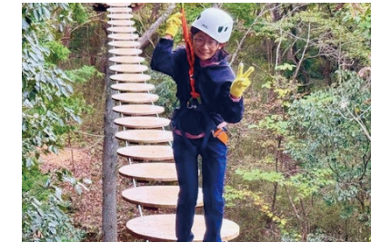
イエヤスステップ