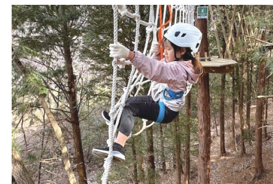
スパイダーネスト