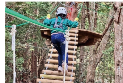
サスペンションステア