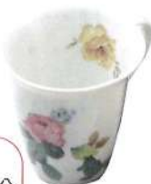
陶絵付け (転写)体験