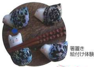
箸置き 絵付け体験