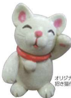
オリジナル 招き猫作り体験