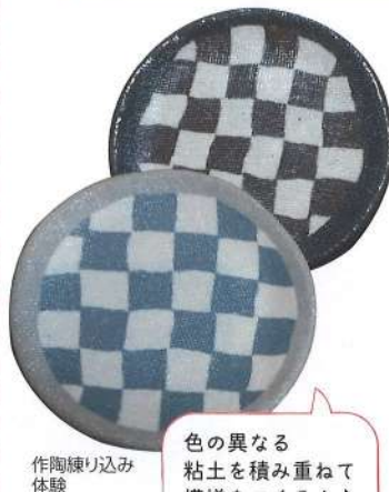
作陶練り込み 体験