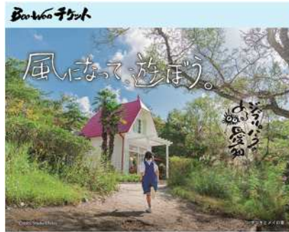
ジブリパークと一緒に楽しみたい「愛知」

愛知県には、日本の原風景である里山や美しい水景、ノスタルジックな街並、職人たちのモノづくりの情熱、自然の恵みを享受して生きる人々の生活、そして少し不思議な感覚に触れられる場所や施設がいっぱい。ジブリパーク訪問前後に、愛知県内各地でジブリの世界観を体感できる旅に出かけよう。